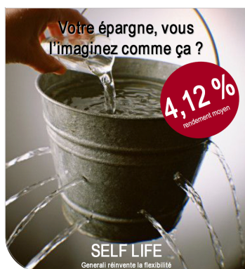
Rémunération nette globale de SELF LIFE depuis sa création

Rémunération moyenne globale nette des 5 dernières années de SELF LIFE (taux garanti + participations bénéficiaires, frais d'entrée préalablement déduits, il n'y a pas de frais de gestion). Taux garanti = max. 3,00 %. Les rendements du passé ne constituent ni une garantie ni une limite pour le futur. Pour de plus amples renseignements, consultez la fiche info disponible sur www.generali.be . SELF LIFE est un produit d'assurance vie de la Branche 21.